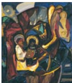
Heilige Ursula 1914/1915 Leihgabe der Ernst von Siemens Kunststiftung, München

Das Kunstforum Ostdeutsche Galerie präsentiert eine umfassende Werkschau des Künstlers und Theoretikers Adolf Hölzel (1853 Olmütz/Mähren – 1934 Stuttgart). Der Maler zeigt sich als ein wichtiger Wegbereiter der Moderne. Wie Wassily Kandinsky, Piet Mondrian oder Robert Delaunay entwickelt Hölzel, der später Professor an der Stuttgarter Akademie wird, Anfang des 20. Jahrhunderts einen neuen Bildbegriff.