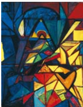
Fuge (über ein Auferstehungsthema) 1916 Landesmuseum für Kunst und Kulturgeschichte Oldenburg

Diese Werkschau, entstanden in Zusammenarbeit mit dem Kunstmuseum Stuttgart, ist zugleich eine längst überfällige lückenlose Dokumentation des vielfältigen künstlerischen Schaffens von Adolf Hölzel. Im Unterschied zu der Präsentation in Stuttgart zeigt das Kunstforum Ostdeutsche Galerie in Regensburg eine veränderte Konzeption mit teilweise anderen Leihgaben.