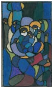
Abstrakte Komposition nach dem Septimenschlüssel 1932/1933 Glasfensterentwurf Kunstmuseum Stuttgart

documentation of Adolf Hölzel's multifaceted oeuvre. In contrast to the presentation in Stuttgart, the Kunstforum Ostdeutsche Galerie in Regensburg shows an altered concept with some different loaned works.