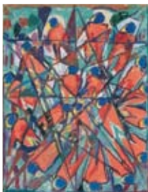
Vielfigurenprisma um 1930 Privatbesitz, Stuttgart