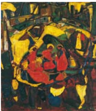
Biblisches Motiv 1914 Kunstmuseum Stuttgart