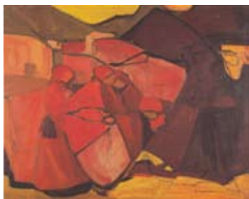
Komposition in Rot I (Rote Komposition) 1905 Sprengel Museum Hannover Leihgabe Kunstsammlung Dresdner Bank