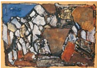
Komposition (Landschaft) 1914 Kunstforum Ostdeutsche Galerie, Regensburg

The Kunstforum Ostdeutsche Galerie presents a comprehensive exhibition of works by the artist and theorist Adolf Hölzel (1853 Olomouc/Moravia – 1934 Stuttgart). As a painter, he was an important pioneer of the Modern Movement. Like Wassily Kandinsky, Piet Mondrian and Robert Delaunay, Hölzel (who was later professor at the Stuttgart Academy) developed a new pictorial concept at the start of the 20th century.