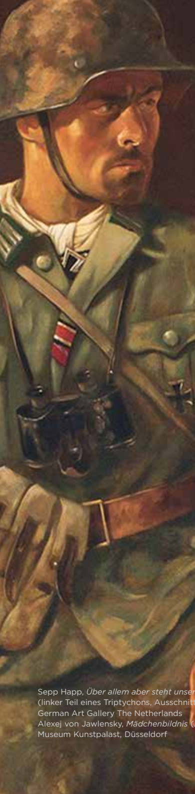
Sepp Haack, Über allem aber steht unsere Infanterie (linker Teil eines Triptychons, Ausschnitt), 1943, Öl auf Leinwand German Art Gallery The Netherlands