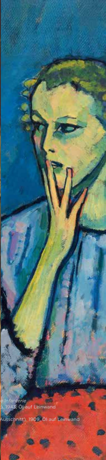
Alexej von Jawlensky, Mädchenbildnis (Ausschnitt), 1909, Öl auf Leinwand Museum Kunstpalast, Düsseldorf