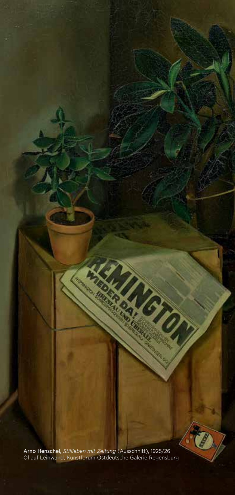
Arno Henschel, Stilleben mit Zeitung (Ausschnitt), 1925/26 Öl auf Leinwand, Kunstforum Ostdeutsche Galerie Regensburg