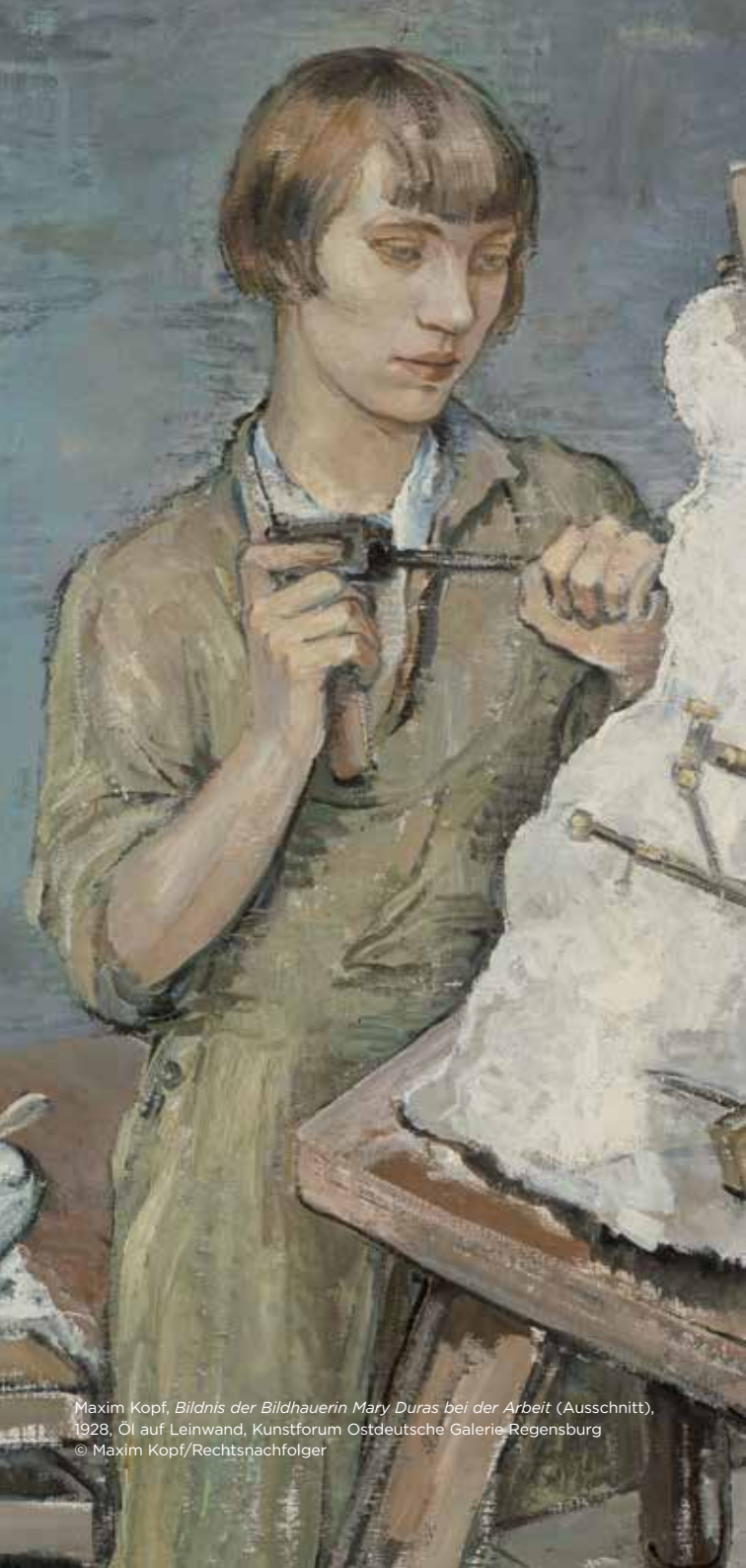
Maxim Kopf, Bildnis der Bildhauerin Mary Duras bei der Arbeit (Ausschnitt) , 1928, Öl auf Leinwand, Kunstforum Ostdeutsche Galerie Regensburg © Maxim Kopf/Rechtsnachfolger