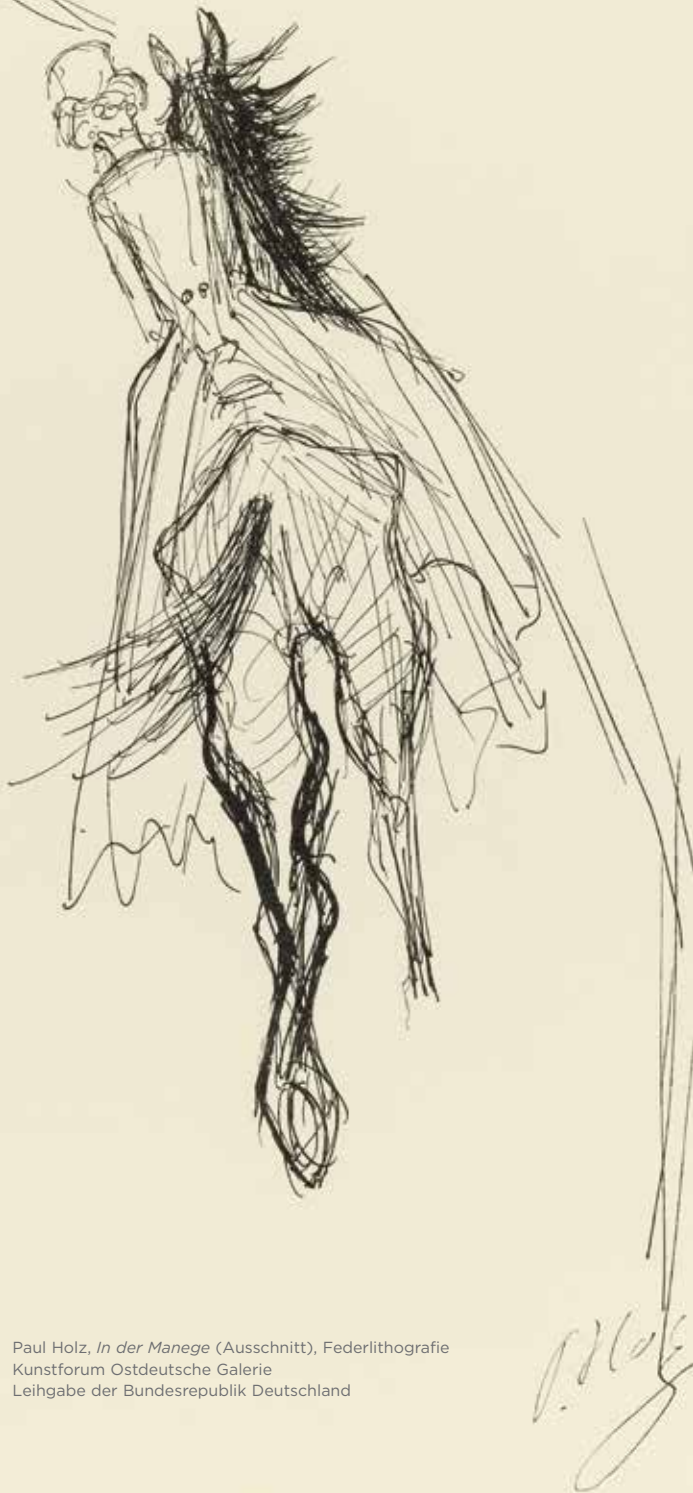
Paul Holz, In der Manege (Ausschnitt), Federlithografie Kunstforum Ostdeutsche Galerie Leihgabe der Bundesrepublik Deutschland