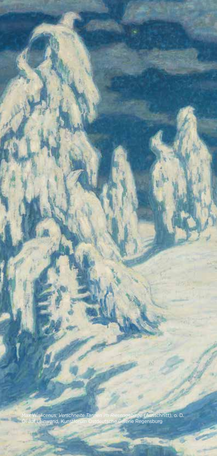
Max Wislicenus, Verschneite Tannen im Riesengebirge (Ausschnitt), o. D. Öl auf Leinwand, Kunstforum Ostdeutsche Galerie Regensburg