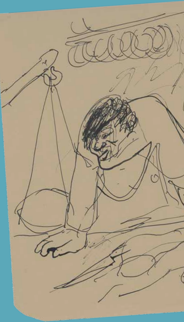
Paul Holz, Fleischer am Ladentisch (Ausschnitt), um 1928 Feder, Tusche auf Zeichenblockpapier Akademie der Künste, Berlin, Kunstsammlung

Die Beauftragte der Bundesregierung für Kultur und Medien Bayerisches Staatsministerium für Familie, Arbeit und Soziales Stadt Regensburg REWAG Sparkasse Regensburg Bert Wilden, Regensburg