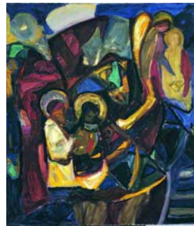
Adolf Hölzel, Heilige Ursula 1914/15, Öl auf Leinwand Kunstforum Ostdeutsche Galerie Regensburg Leihgabe der Ernst von Siemens Kunststiftung München