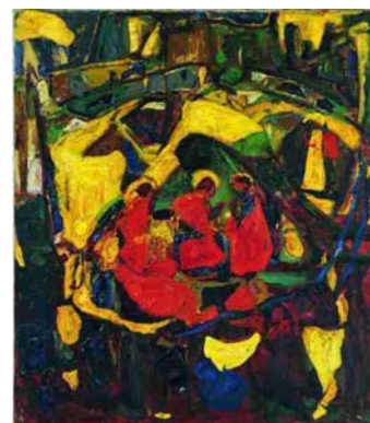
Adolf Hölzel, Biblisches Motiv 1914, Öl auf Leinwand Kunstmuseum Stuttgart