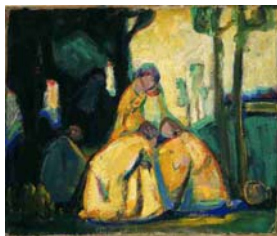
Adolf Hölzel, Grüne Anbetung Um 1908, Öl auf Leinwand, auf Sperrholz Kunstforum Ostdeutsche Galerie, Regensburg