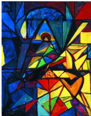
Adolf Hölzel, Fuge (Über ein Auferstehungsthema) 1916, Öl auf Leinwand Landesmuseum für Kunst- und Kulturgeschichte Oldenburg