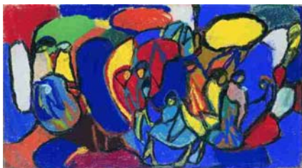
Adolf Hölzel, Figurale Komposition Um 1930, Pastell, Graphit, Kohle auf Papier auf Karton Kunstforum Ostdeutsche Galerie, Regensburg