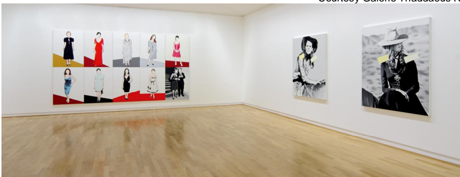
Blick in die Ausstellung, Foto: Wolfram Schmidt, Regensburg.