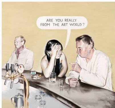
Marcin Maciejowski, Are You Really from The Art World?, 2009, oil on canvas, 130 x 140 cm, Private Collection