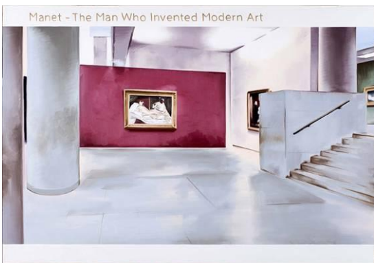
Marcin Maciejowski, Manet, 2009, oil on canvas, 140 x 200 cm, Courtesy Galerie Thaddaeus Ropac Salzburg/Paris