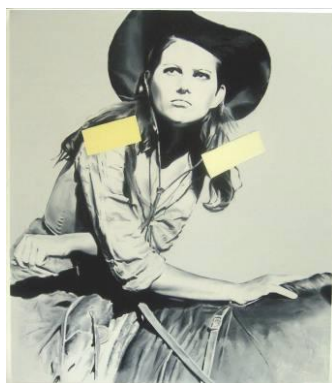
Marcin Maciejowski, Do not copy, CC, 2006, oil on canvas, 150 x 130 cm, Private Collection Courtesy Galerie Thaddaeus Ropac Salzburg/Paris