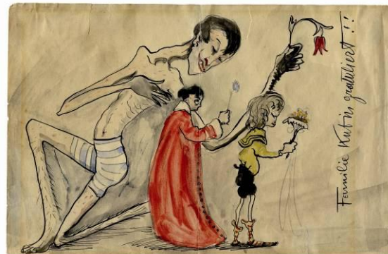
Alfred Kubin, Familie Kubin gratuliert!!, um 1905, Feder und Aquarell, © Eberhard Spangenberg / VG Bild-Kunst, Bonn 2010