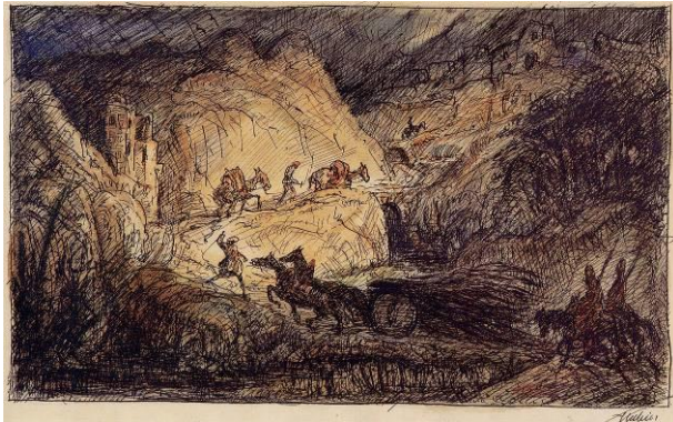
Alfred Kubin, Aus Bosnien, 1909 oder 1920, Tusche und Aquarell, © Eberhard Spangenberg / VG Bild-Kunst, Bonn 2010