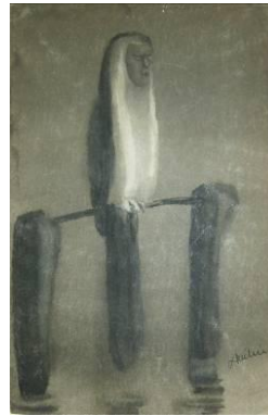
Alfred Kubin, Vogelmensch, um 1904/05, Gouache, © Eberhard Spangenberg / VG Bild-Kunst, Bonn 2010