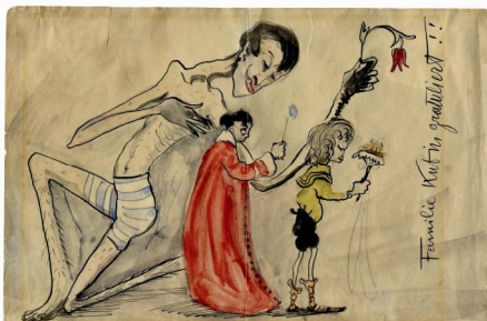
Alfred Kubin, Familie Kubin gratuliert!!, um 1905, Feder und Aquarell

Waldgeister, Kobolde und andere Phantasiewesen – einer der eigenwilligsten Zeichner der ersten Hälfte des 20. Jahrhunderts, Alfred Kubin (1877-1959), ist ab 18. Juli mit einer umfangreichen Ausstellung im Kunstforum zu sehen.