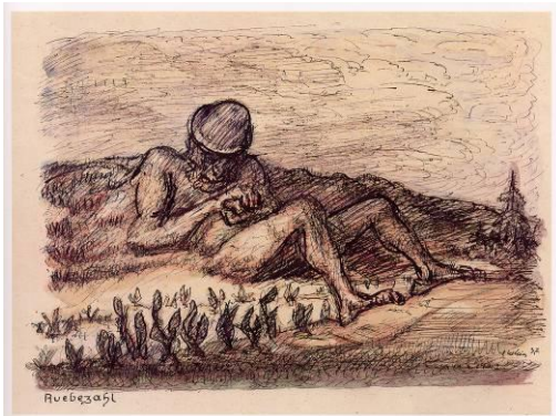
Alfred Kubin, Rübezahl, 1937, Tusche und Aquarell, © Eberhard Spangenberg / VG Bild-Kunst, Bonn 2010