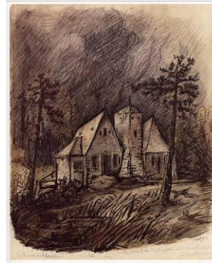
Alfred Kubin, Unbewohntes Haus, 1925, Tusche und Aquarell, © Eberhard Spangenberg / VG Bild-Kunst, Bonn 2010