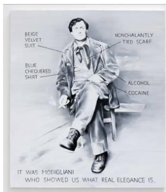
Marcin Maciejowski, It was Modigliani, 2009, oil on canvas, 160 x 140 cm, Private Collection London