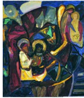
Adolf Hölzel, Heilige Ursula 1914/15, Öl auf Leinwand Kunstforum Ostdeutsche Galerie Regensburg Leihgabe der Ernst von Siemens Kunststiftung München