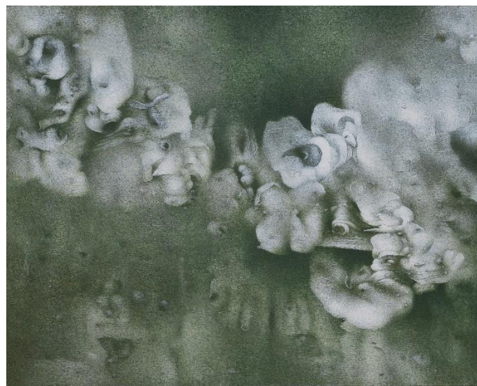
Richard Oelze Im Dunkel der Entwicklung , 1965/66 Leihgabe der Bundesrepublik Deutschland © Richard Oelze / Till Schargorodsky