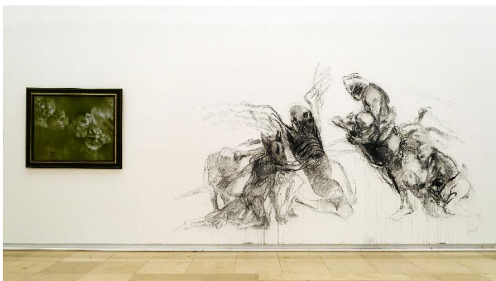
Wandzeichnung von Georg Tassev © Georg Tassev