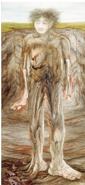
Anton Lehmden Der Golem , 1983/84 ©VG Bild-Kunst, Bonn 2023 Leihgabe der KfW Bankengruppe, Bonn