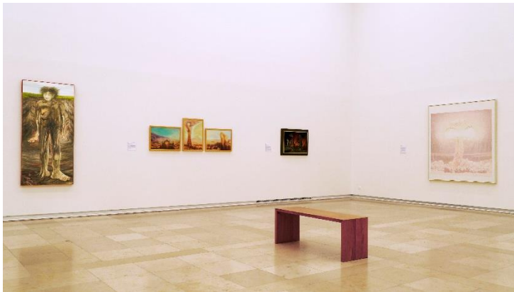
Installationsansicht aus der Ausstellung „Traum und Trauma“ mit Werken von Anton Lehmden, Kurt Melzer, Augustin Tschinkel und Ulrich Gansert