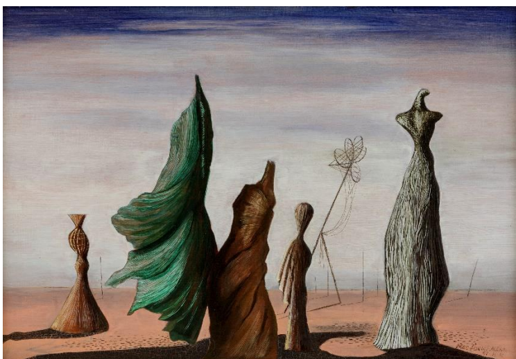
Mac Zimmermann, Verwandlung , 1951 Öl auf Leinwand, Leihgabe der Bayerischen Staatsgemälde­sammlungen, München © VG Bild-Kunst, Bonn 2023