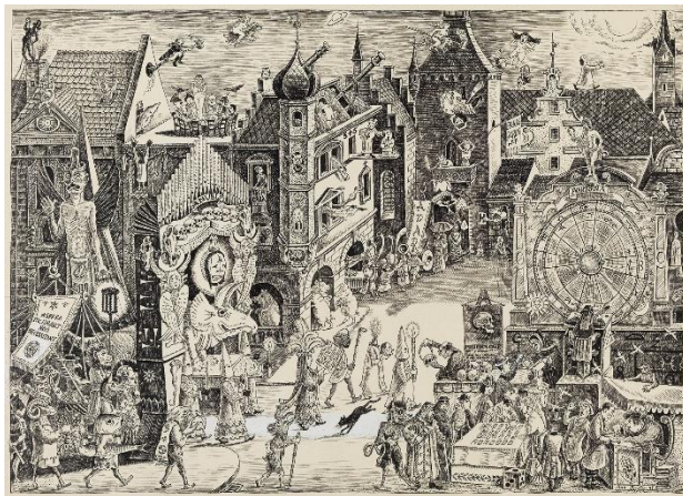
Max Radler Nacht des Aberglaubens, 1947 Zeichnung für den „Schwabinger Bilderbogen“ © Max Radler / Rechtsnachfolger Kunstforum Ostdeutsche Galerie Regensburg Foto: Wolfram Schmidt Fotografie, Regensburg