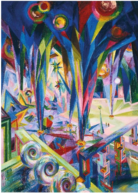
Wenzel Hablik Dom-Inneres. Festhalle – Gondelkanal – Wasserkünste – leuchtende Gasglasballons, 1921 Leihgabe der Bundesrepublik Deutschland