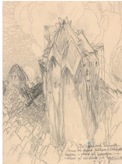
Wenzel Hablik Kristallberg, 1907 Kunstforum Ostdeutsche Galerie Regensburg