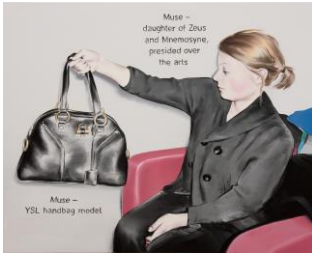
Marcin Maciejowski, Muse , Öl auf LW