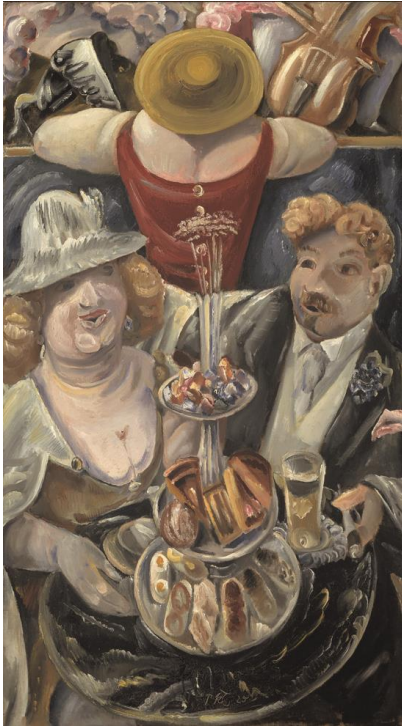
Paul Kleinschmidt, Kaffeekonzert, 1925 Kunstforum Ostdeutsche Galerie, Leihgabe der Bundesrepublik Deutschland

https://www.kunstforum.net/pressebereich/pressemitteilungen/article/die-goldenen-zwanziger-und-paul-kleinschmidts-kaffeekonzert-fuehrung-durch-die-dauerausstellung