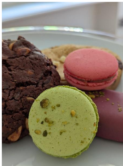
Süßigkeiten von Heavens Taste im Museumscafé des Kunstforums Ostdeutsche Galerie