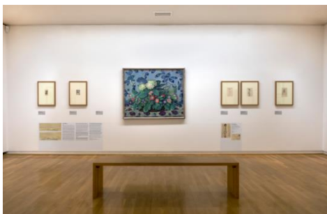
Ausstellung „Emil Orlik an Max Lehrs. Künstlerpost aus aller Welt“ Installationsansicht Kunstforum Ostdeutsche Galerie Regensburg