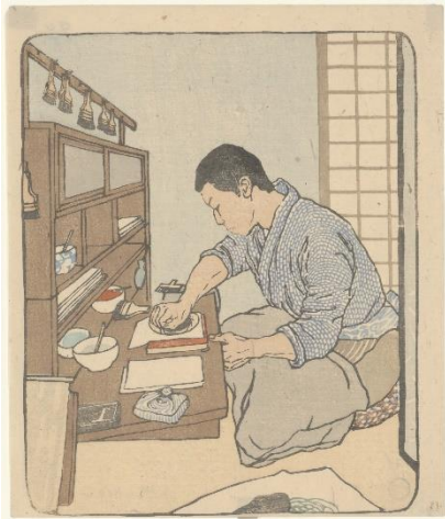
Emil Orlik Japanischer Drucker, 1900 Holzschnitt Kunstforum Ostdeutsche Galerie Regensburg