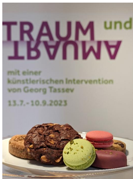
Süßigkeiten von Heavens Taste im Museumscafé des Kunstforums Ostdeutsche Galerie