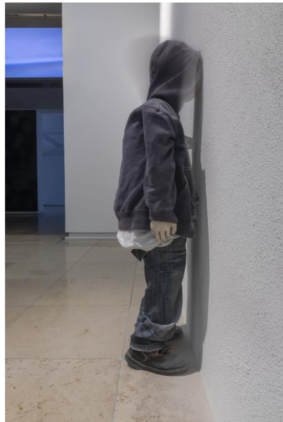
Krištof Kintera Revolution, 2005 Private Collection SbírKa s.r.o., Prag © Krištof Kintera