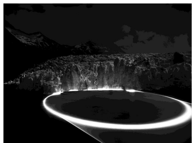
Magdalena Jetelová Linie 2062 aus der Serie The Pacific Ring of Fire , 2017/18 Lightbox