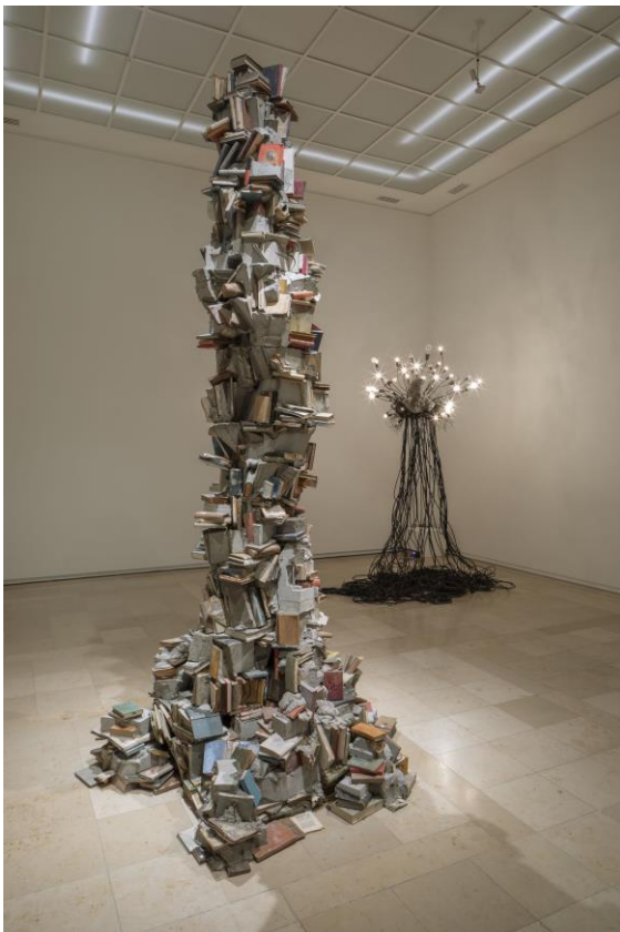
Krištof Kintera The End of Words III, 2014–2015 und Past Thinking About Future When Watching You, 2016, COLLETT Prague | Munich © Krištof Kintera