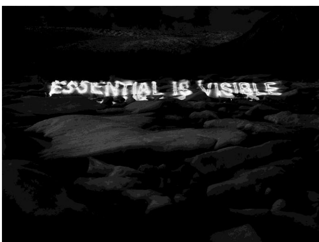
Magdalena Jetelová Konversation 1580 aus der Serie The Pacific Ring of Fire , 2017/18 Lightbox © Magdalena Jetelová