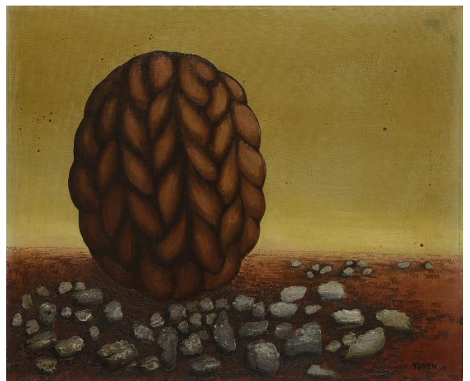
Toyen Oblázky večera (Kieselsteine des Abends) , 1937 Öl auf Leinwand The Gallery of West Bohemia in Pilsen © VG Bild-Kunst, Bonn 2021