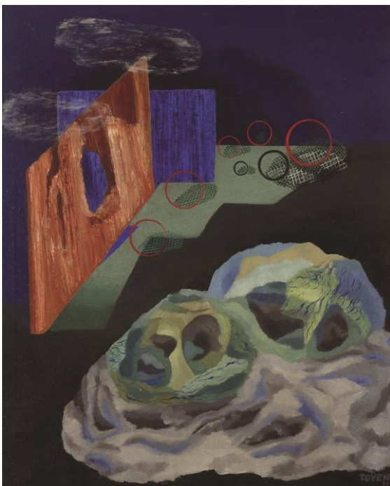
Toyen Obraz (Das Bild) , 1932 Öl auf Leinwand The Gallery of West Bohemia in Pilsen

Wir bitten um Übersendung eines Belegexemplars an die Pressestelle des Kunstforums Ostdeutsche Galerie.