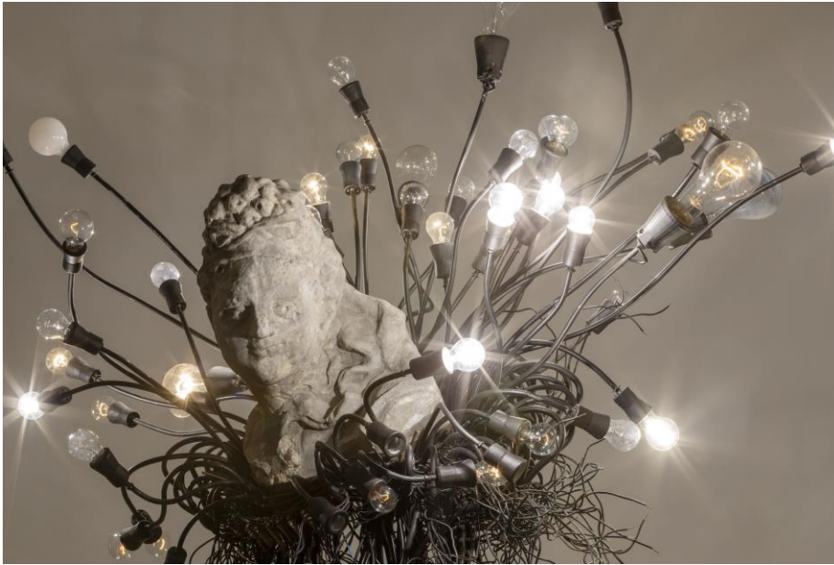
Krištof Kintera Past Thinking About Future When Watching You, 2016 COLLETT Prague | Munich © Krištof Kintera