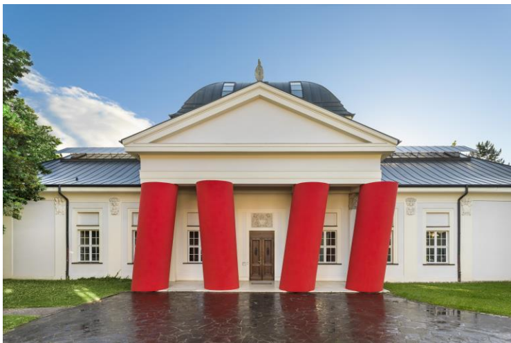
Kunstforum Ostdeutsche Galerie mit Installation von Magdalena Jetelová, Venceremos / Sale , 2006 Kunstforum Ostdeutsche Galerie Regensburg © Magdalena Jetelová

https://www.kunstforum.net/pressebereich/pressemitteilungen/article/ausblick-auf-das-jahr-2025-im-kunstforum-ostdeutsche-galerie