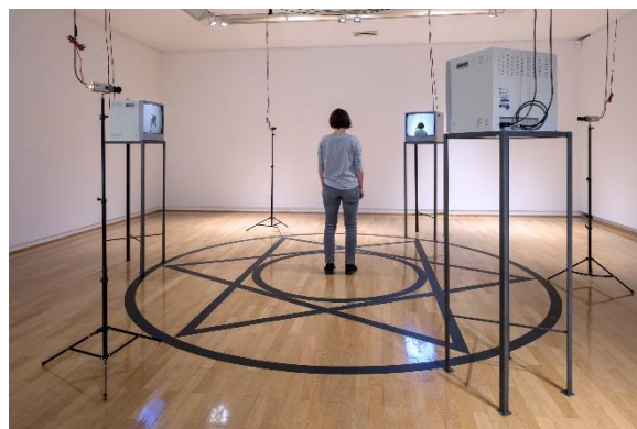
Peter Weibel Beobachtung der Beobachtung: Unbestimmtheit, 1973; Closed-Circuit-Videoinstallation; drei Videokameras auf Metallgestellen, Bodenmarkierung