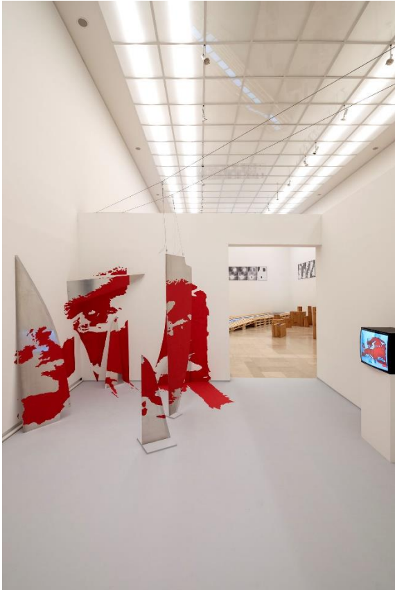
Peter Weibel Europa(t)raum , 1983; Closed-Circuit-Videoinstallation; Stahlplatten, Farbe, Monitor, Videokamera