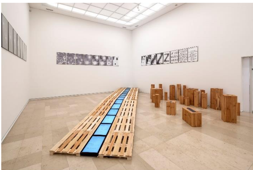
Peter Weibel Die Vertreibung der Vernunft , 1993; Computerbasierte Videoinstallation; 14 Monitore, Computer, Ton, Holzpaletten mumok – Museum moderner Kunst Stiftung Ludwig Wien, erworben 2001 / ZKM | Zentrum für Kunst und Medien Karlsruhe