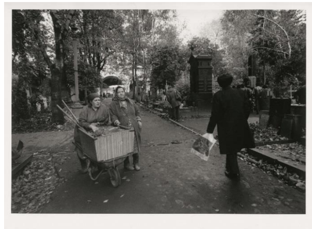
Barbara Klemm; Babushki auf dem Novodewitschi Friedhof in Moskau 1987, 1987/2019; Silbergelatine auf Barytpapier Hans-Peter Riese Privatsammlung © Barbara Klemm