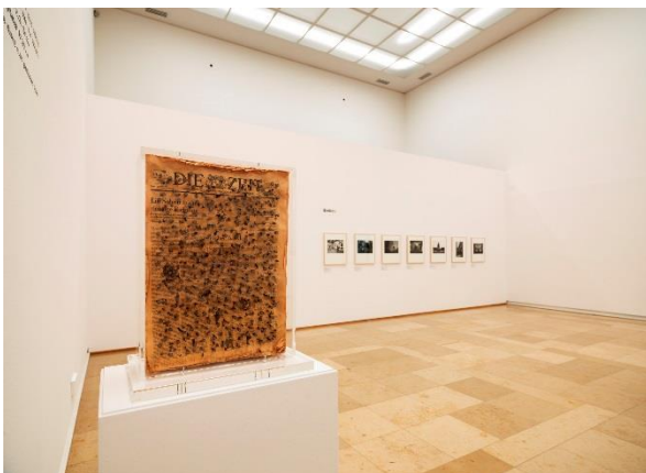
Blick in die Ausstellung „reisen. entdecken. sammeln.“ im Kunstforum Ostdeutsche Galerie, rechts Günther Uecker, O.T. , 1985 Zeitungen, Nägel, Hans-Peter Riese privatsammlung © VG Bild-Kunst, Bonn 2020