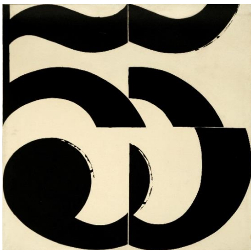
Miloš Urbásek, Thema 5 , 1966 Acryl auf Leinwand Michaela Riese Stiftung, Kunstforum Ostdeutsche Galerie © Miloš Urbásek / Rechtsnachfolger

Wir bitten um Übersendung eines Belegexemplars an die Pressestelle des Kunstforums Ostdeutsche Galerie.