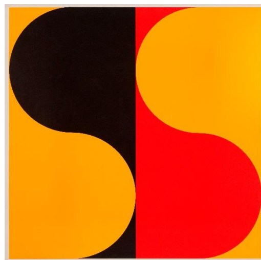
Miloš Urbásek, S/56 , 1971, Siebdruck auf Papier, Michaela Riese Stiftung, Kunstforum Ostdeutsche Galerie © Miloš Urbásek / Rechtsnachfolger