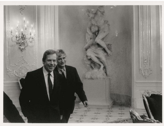
Barbara Klemm: Václav Havel und Jiří Dienstbier auf der Prager Burg, 1990/2019 Silbergelatine auf Barytpapier Leihgabe Barbara Klemm