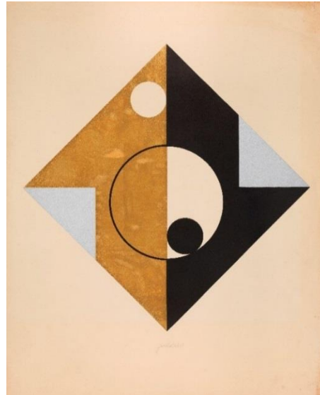
Jan Kubiček, o. T. , 1967, Siebdruck, Michaela Riese Stiftung, Kunstforum Ostdeutsche Galerie © Jan Kubiček / Rechtsnachfolger